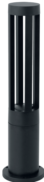
DH301 арт. 11670