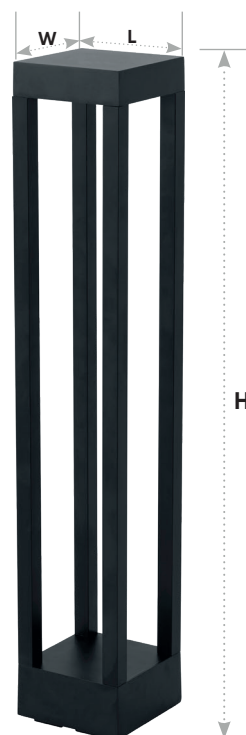
DH402 арт. 11672